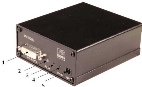
Вид со стороны «входа»