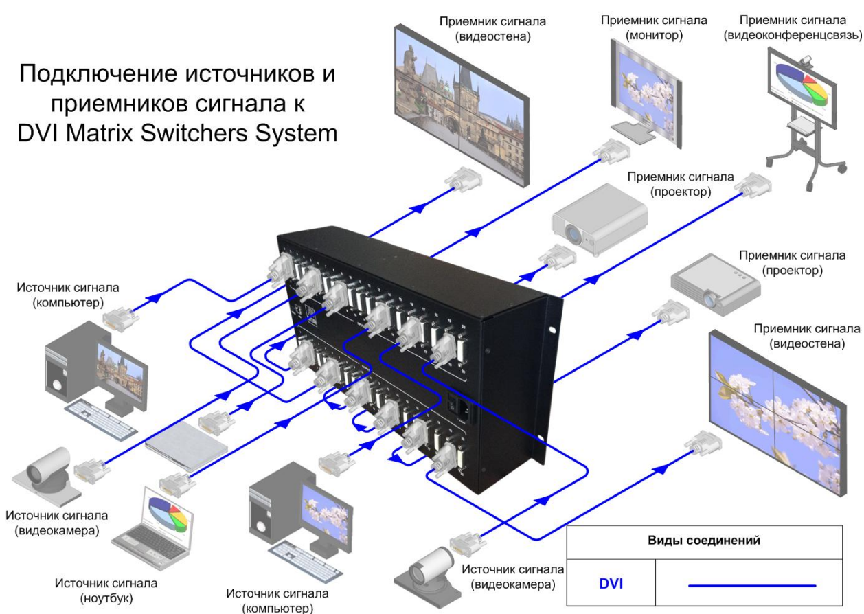
Схема подключение матрицы